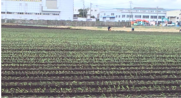
↑ 宮崎都城中生玉葱圃場