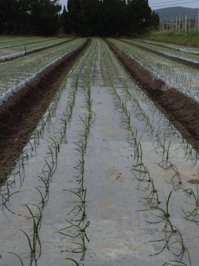
↑ 鹿児島指宿極早生玉葱の圃場